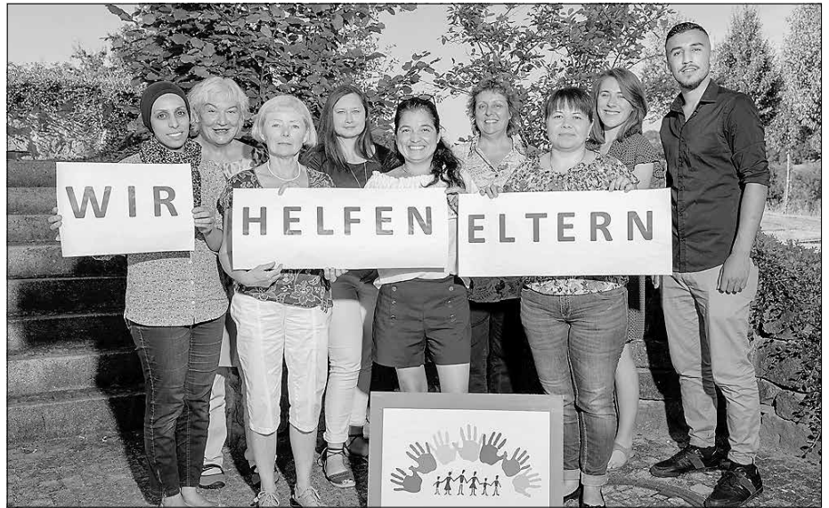
Interkulturelle Elternmentoren engagieren sich.

Die Begleitung und Vermittlung der interkulturellen Elternmentoren erfolgt über das Landratsamt Hohenlohekreis. Auskunft erhalten Sie unter elternmentoren@hohenlohekreis.de und 07940 93769-10.