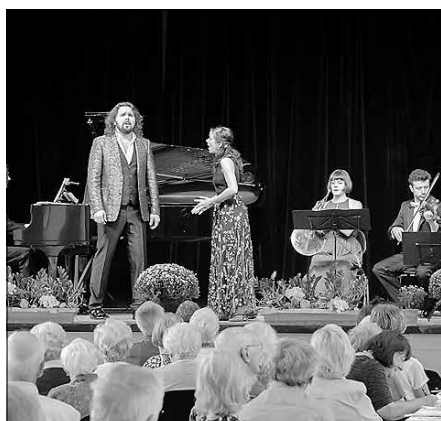
Die klassischen Konzerte am Nachmittag in der Stadthalle sind sehr beliebt.