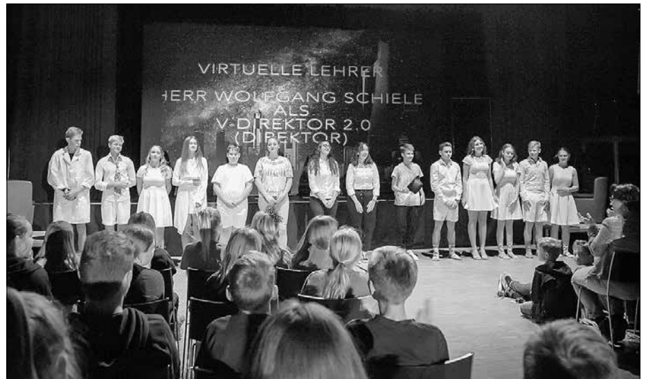
Die Theatergruppe der Freien Schule Anne-Sophie.