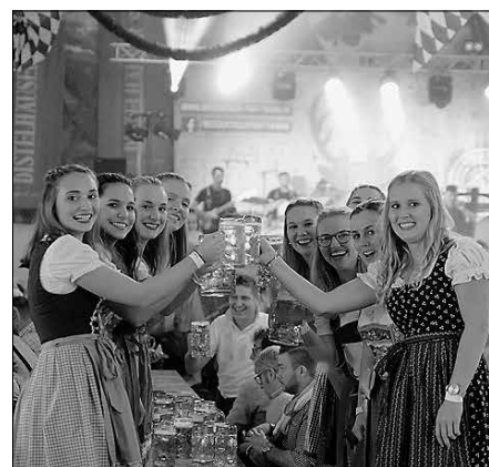
Die Künzelsauer Wert-Wies'n erfreuen sich immer größerer Beliebtheit.