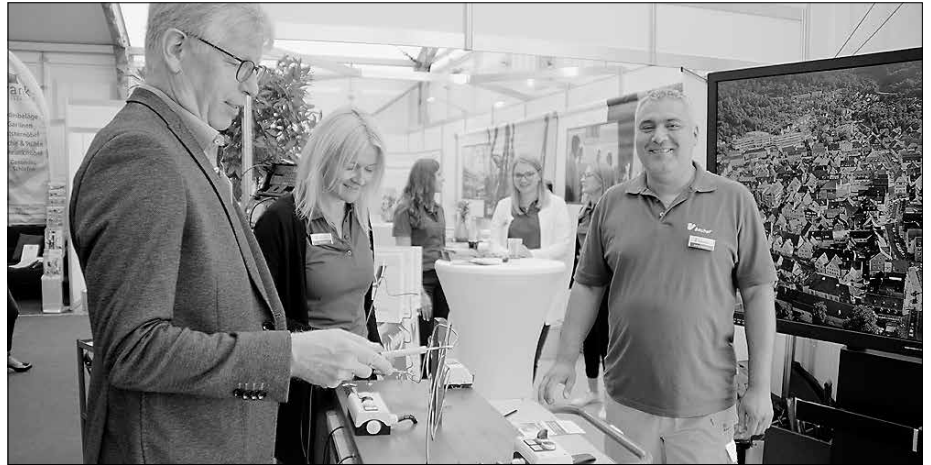
In sechs Hallen der Hohenloher Wirtschaftsmesse haben sich rund 180 Aussteller präsentiert.