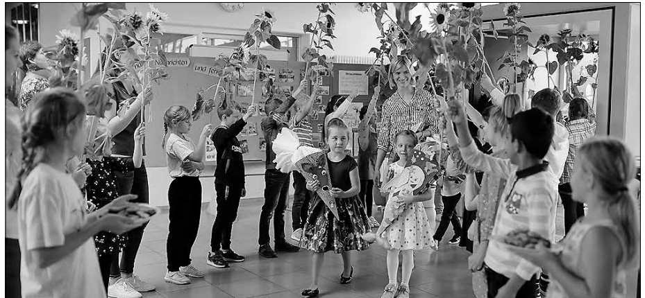
Die neuen Erstklässler wurden in der Grundschule Taläcker begrüßt.