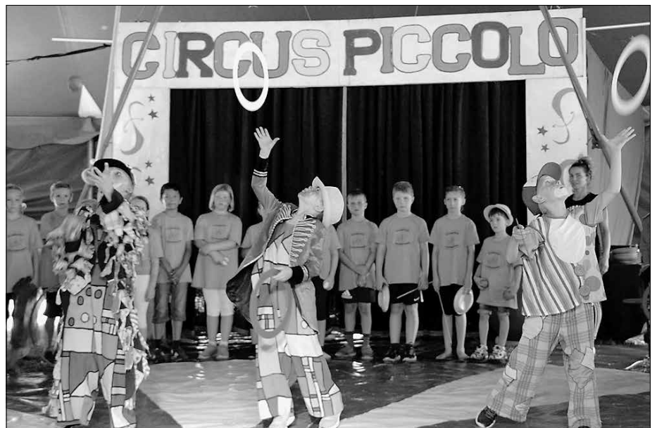
Schüler der Grundschule Amrichshausen begeistern das Publikum.