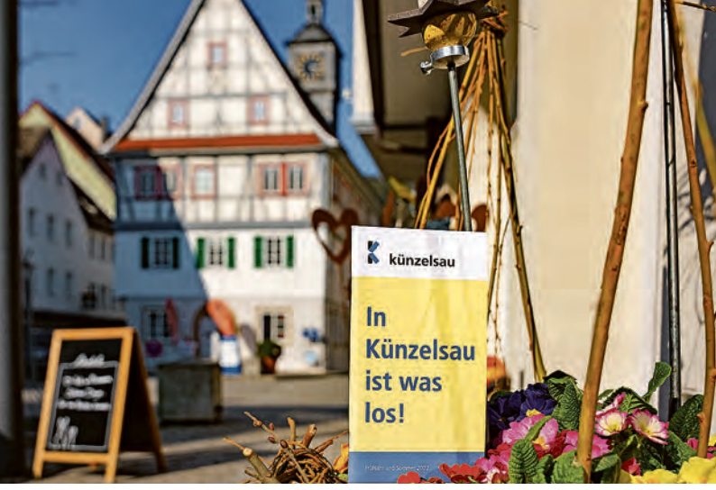
Was Frühjahr und Sommer in Künzelsau zu bieten haben, ist in der handlichen Broschüre nachzulesen.

Jugendzentrum „Z“ in Künzelsau, Lindenstraße 18: Montag bis Donnerstag und jeden ersten Samstag im Monat von 15 bis 20 Uhr; Freitag von 15 bis 21 Uhr; Jugendblockhaus Taläcker, Lipfersberger Weg 4: Montag und Freitag von 15 bis 20 Uhr; Mittwoch von 17 bis 20 Uhr.